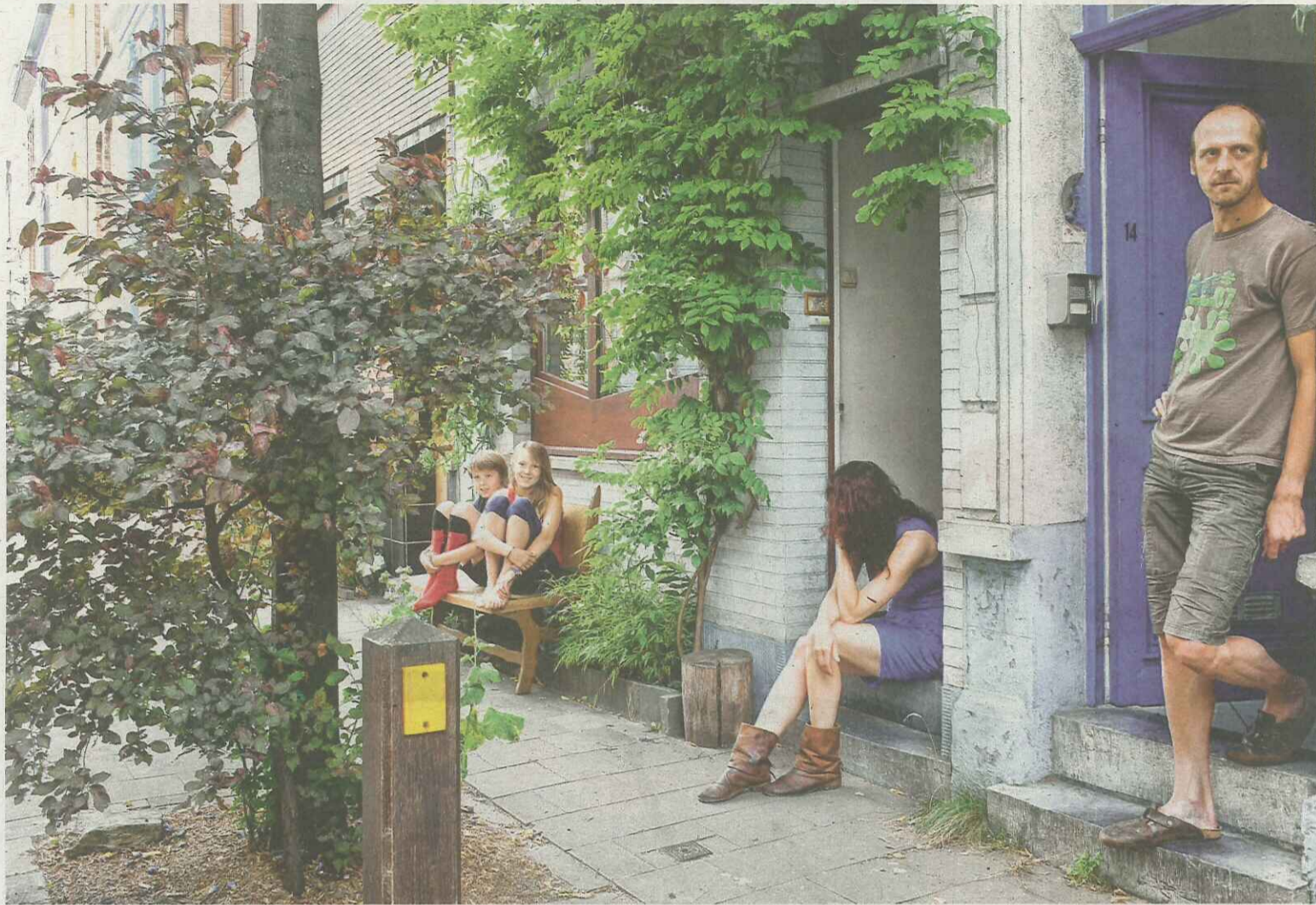
Twee voordeuren of 'living together apart': de nieuwe leefvorm is aan een opmars bezig.

'Natuurlijk is het onge- woon, maar het is tenminste waarachtig. Ik ervaar het als een grote luxé om zo te kunnen leven'